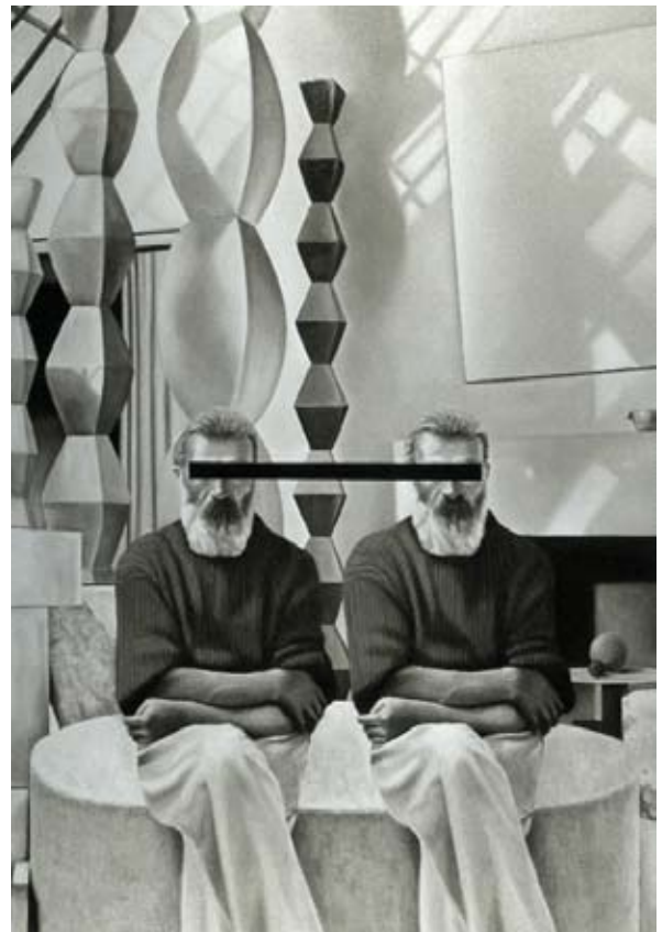
ENDLESS PORTRAIT, 2006

Oil on canvas / Huile sur toile, 72 x 50 inches / 183 x 127 cm