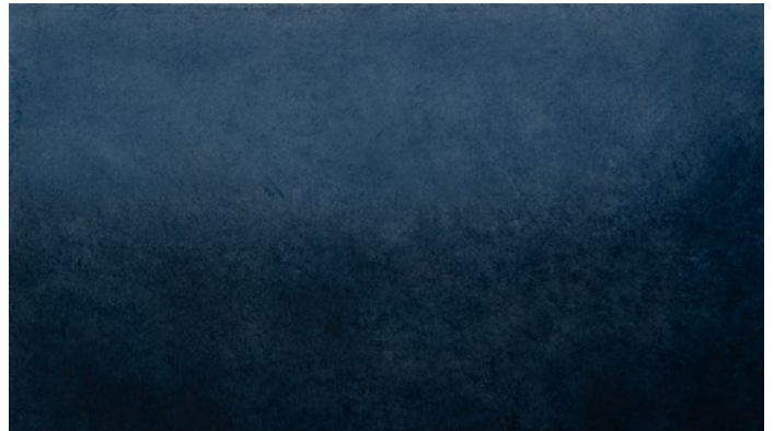
Wave #151 2023 Poudre de pigments minéraux sur papier de chanvre monté sur bois / 17 x 30 cm (6 3/4 x 11 3/4 in)