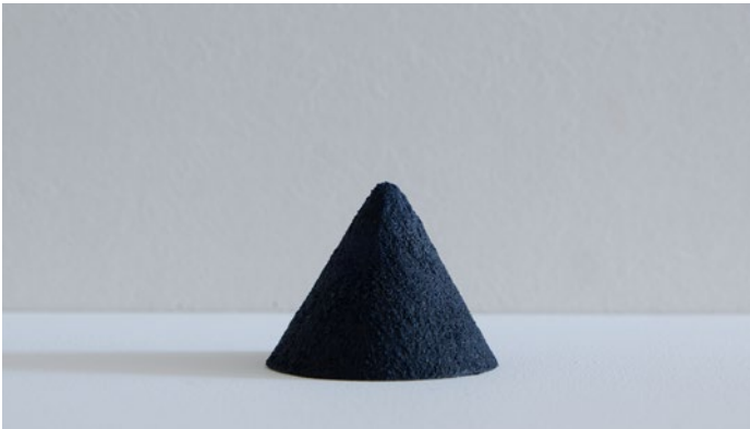
Sans titre 2023 Poudre de pigments minéraux sur papier japonais Ø 6 cm x H 5 cm (Ø 2 3/8 x H 2 in)